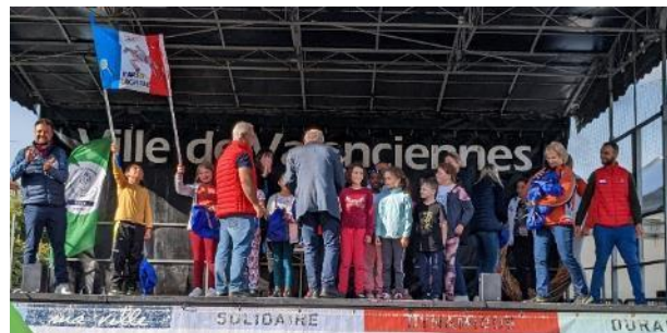
Remise des médailles aux trois classes lauréates et des récompenses à toutes les autres classes