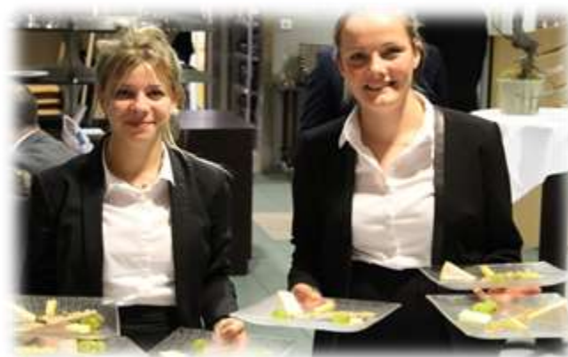
Le lycée Jessé de Forest, un lycée hôtelier tourné vers l'international