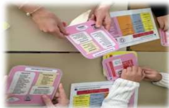
Jeu Time's Up Métiers : On joue et on découvre