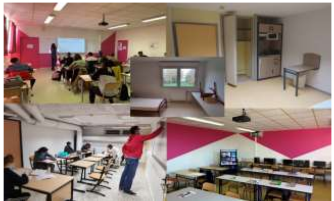
Salle de classe (en haut à gauche) ; studio individuel à l'internat d'Excellence (milieu et en haut à droite) ; salle de travail en autonomie (en bas à droite) ; salle de travail à l'internat d'Excellence (en bas à gauche)