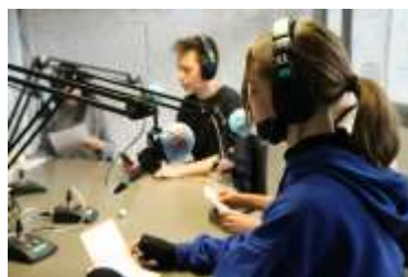
Les élèves du collège Villars de Denain enregistrent leur émission de radio, dans les studios de l'ESJ Lille, le 7 avril 2022.