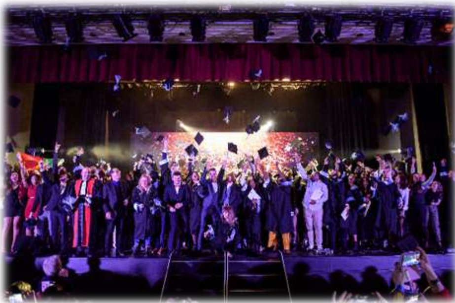
IUT de l'Oise - Une formation, un avenir