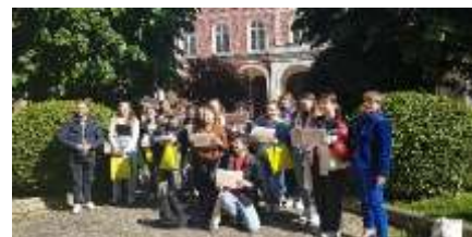
Finale Challenge inter lycées en langue anglaise- juries avec des élèves de CPGE