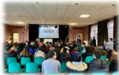
Lancement des cordées de la réussite Conférence : Les ondes gravitationnelles pour une centaine de collégiens et lycéens encordés