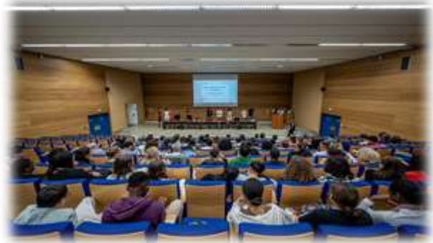
Évènement de clôture du 18 mai 2022 – Amphi prestige Campus Pont de Bois