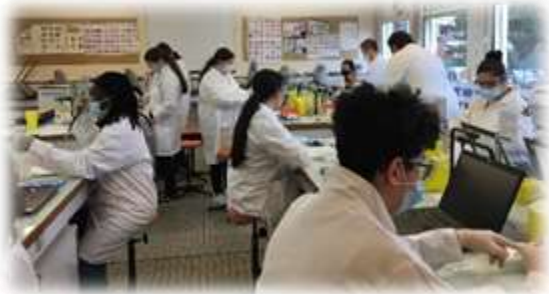
A la découverte des Biotechnologies