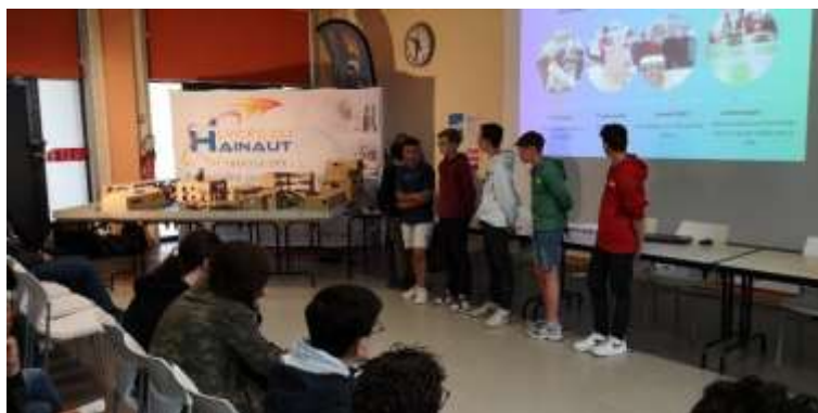
Des élèves de Troisième lors de la journée de restitution (juin 2023)