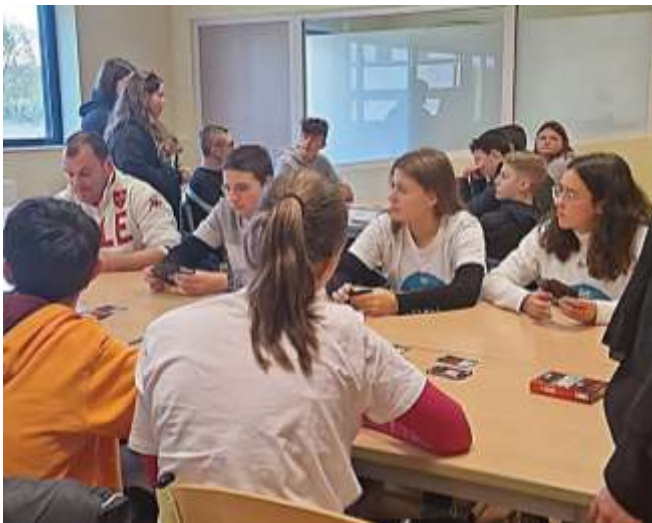
Atelier Jeux de société & maths animé par des étudiants de 2 e année de BUT