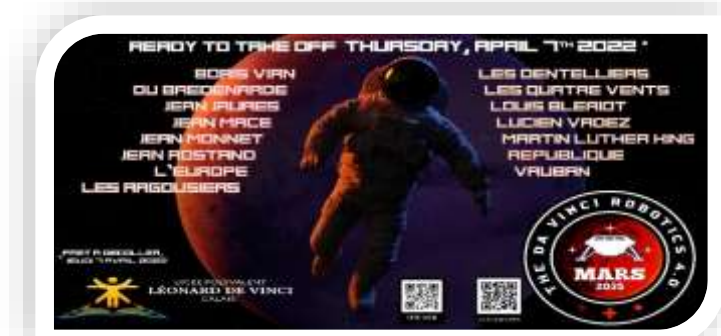
The Da Vinci Robotics 4.0 : Objectif Mars 2035..... https://davincirobotics.fr/