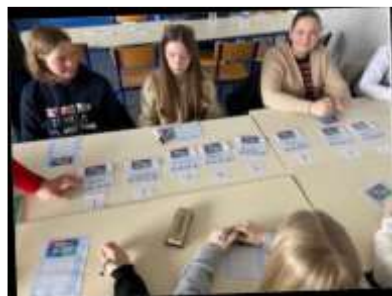
Photo illustrant notre animation Proje'toi basée sur la découverte des métiers avec des collégiens.