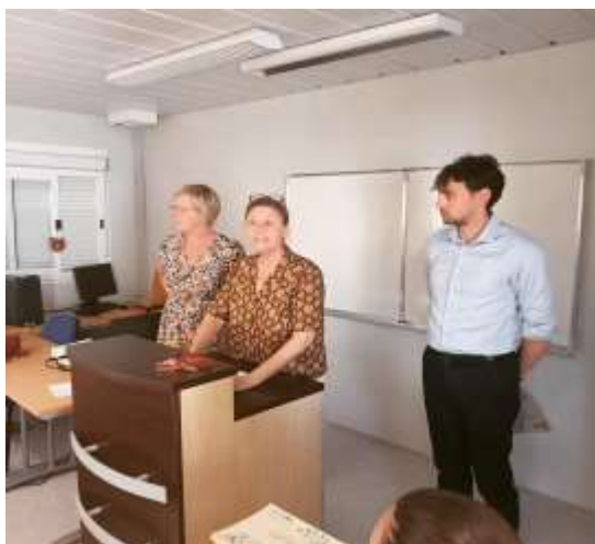
Remise d'attestation cordées de la réussite