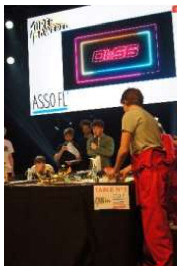
Finale Coupe FL League