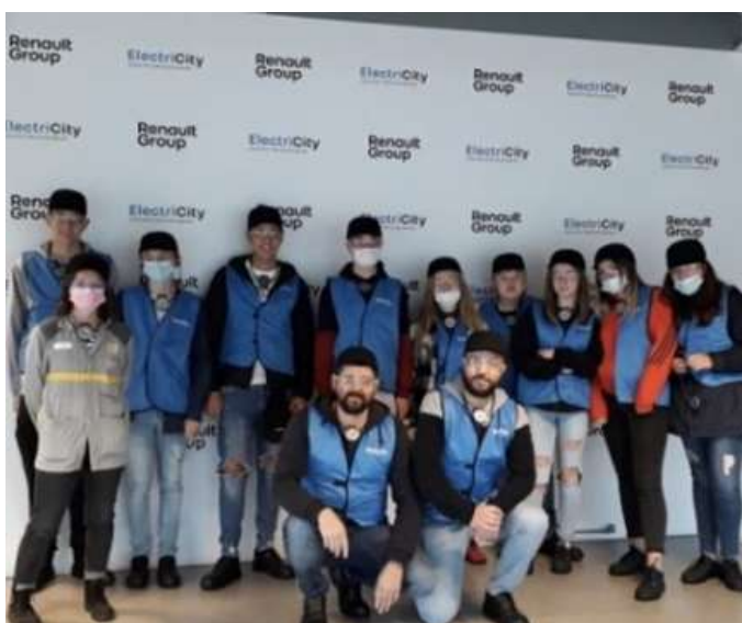
Visite du site MCA Maubeuge