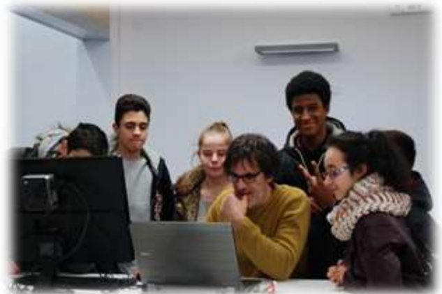
Atelier de création du Fablab avec un enseignant chercheur de Centrale Lille