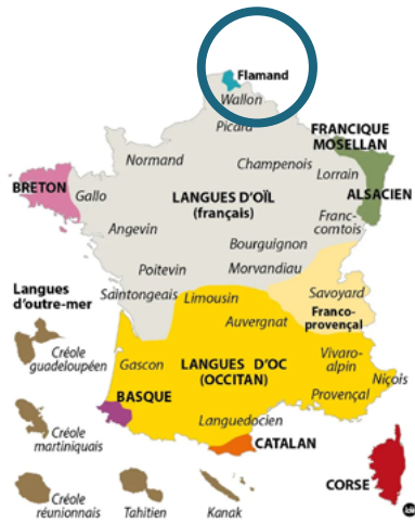
LES LANGUES RÉGIONALES DE FRANCE