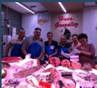
De Boulogne-sur-Mer à Madrid : cap sur l'Espagne pour les élèves du bac pro

En octobre, les apprenants en bac pro poissonnier-écailler-traiteur du lycée professionnel Jean-Charles Cazin de Boulogne-sur-Mer ont eu l'opportunité de réaliser un stage de trois semaines en entreprise à Madrid. Par leur professionnalisme et leur savoir-faire, ils ont pu mettre en lumière ce baccalauréat unique dans les Hauts-de-France. Ce projet d'ouverture européenne mené par l'équipe des relations internationales du LP est soutenu par le Campus des Métiers Approvisionnement, Valorisation et Commercialisation des Produits Aquatiques (AVCPA) basé à Boulogne-sur-Mer. Ainsi, en parallèle du stage des apprenants, une représentante de ce Campus a pu rencontrer ses homologues espagnols et échanger au sujet du contexte de formation dans la filière des produits aquatiques et sur les actions de promotion et d'attractivité de cette filière. Le succès de ce projet commun laisse présager de belles perspectives pour de futures collaborations et de nouveaux projets.